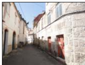
Fachada do Edifício