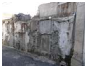
Fachada do Edifício