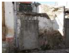
Fachada do Edifício