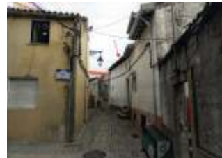
Fachada do Edifício