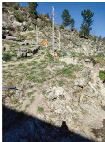
Foto n.º 2 - Parte do terreno delimitado pelo muro