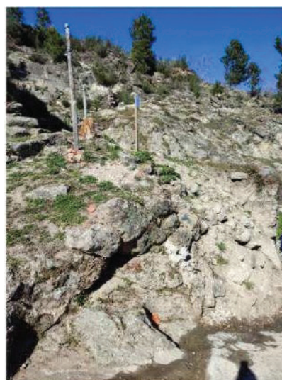
Foto n.º 3 - Pormenor da falta de consolidação entre os elementos que compõem o muro