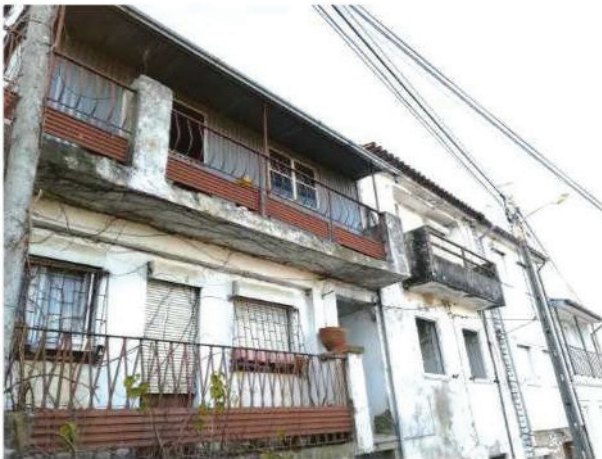
2. Fachada principal