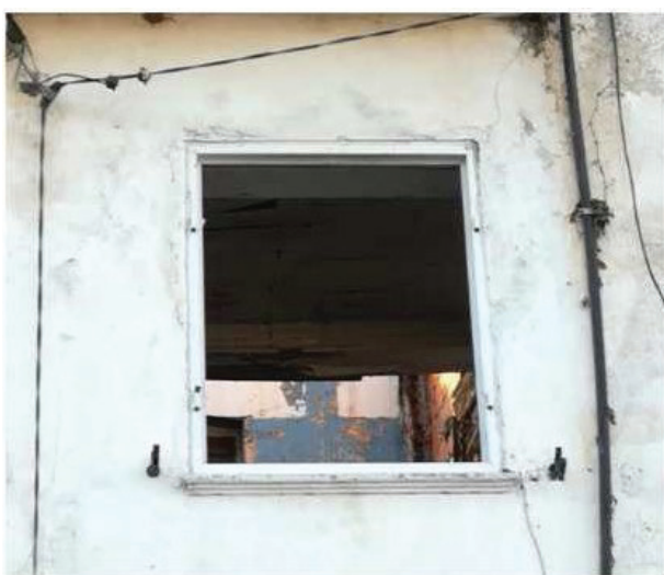
8. Pormenor do interior, a céu aberto.