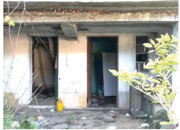
4. Piso térreo