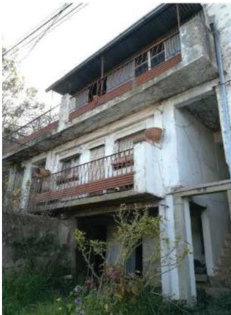
3. Fachada principal