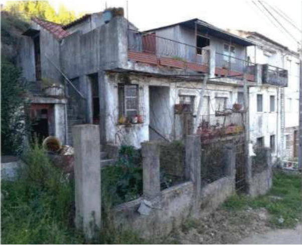
1. Fachada principal