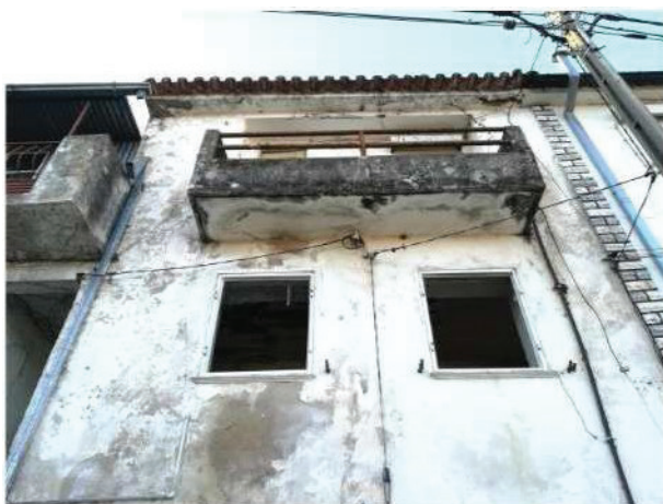
7. Pormenor da fachada