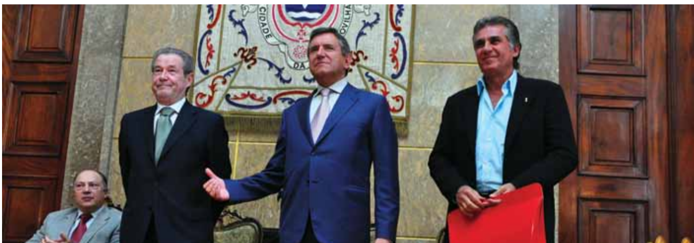
Carlos Abreu | Gilberto Madaíl | Carlos Pinto | Carlos Queiroz

Dezenas de pessoas, entre jornalistas e público em geral, assistiram, no dia 20 de Abril, à Assinatura do Protocolo de Colaboração entre a Federação Portuguesa de Futebol e a Câmara Municipal da Covilhã, com vista ao Estágio da Selecção Nacional no decurso do próximo mês de Maio na Covilhã.