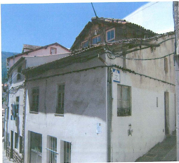
Fachada do Edifício