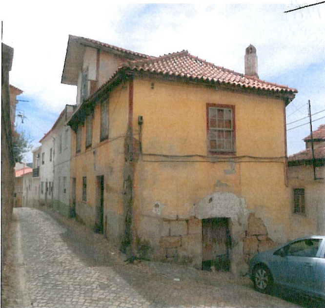
Fachada do Edifício