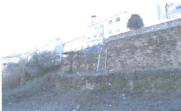
Fachada do Edifício