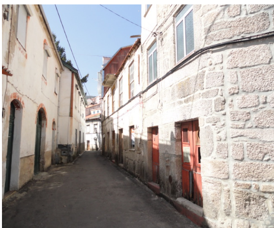
Localização do Edifício