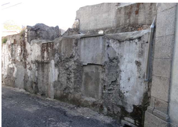
Fachada do Edifício