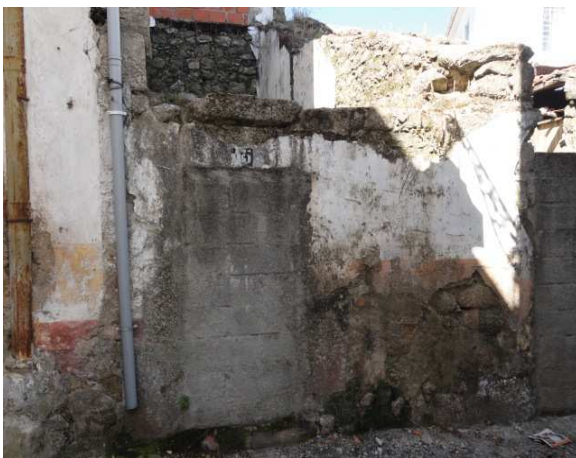
Fachada do Edifício