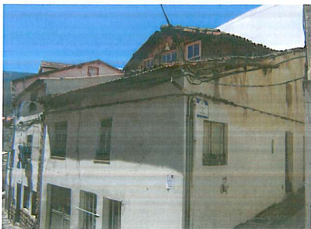
Fachada do Edifício