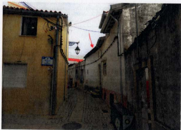
Fachada do Edifício